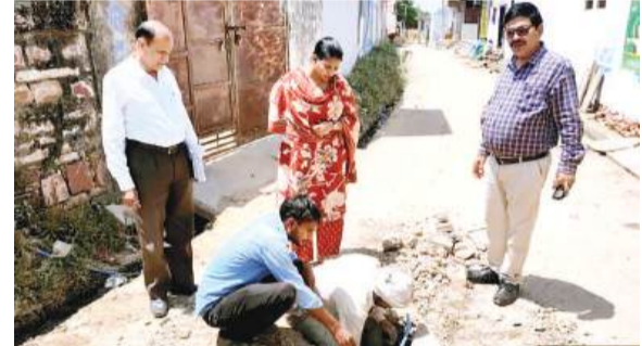
महानगर टाइम्स संवाददाता

अधिकारी, तहसीलदार एवं खंड विकास अधिकारियों ने जनस्वास्थ्य अभियानिकी विभाग के तकनीकी अधिकारियों के साथ गांव-गांव जाकर कार्यों का निरीक्षण किया और मौके पर ही मरम्मत कार्य करवाकर समस्याओं का निस्तारण किया। इस अभियान के अंतर्गत 2677 कार्यों का निरीक्षण किया गया, जिनमें जल जीवन मिशन के 407, अमृत के 80, ग्रीष्मकालीन कंटी-जैसी के 77 कार्य एवं अवरुद्ध हैंडपंप, क्षतिग्रस्त पाइप लाइन इत्यादि शामिल हैं। इसी प्रकार विभाग के तकनीकी कर्मचारियों की मरम्मत कर दुरुस्तीकरण किया गया।