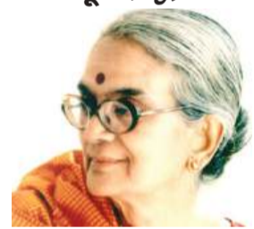
महानगर टाइम्स संवाददाता