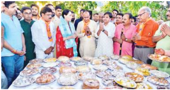
महानगर टाइम्स संवाददाता

जयपुर। भगवान परशुराम जन्मोत्सव के उपलक्ष्य में ब्राह्मण समाज की ओर से विद्याधर नगर स्थित परशुराम सिकंदर पर वेद मंत्रोच्चार के साथ दुर्गाभिषेक किया गया। सैकड़ों दीपकों से महाआरती की गई।