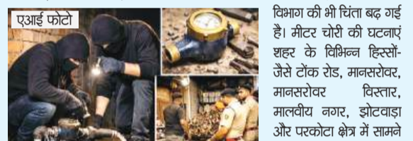
एक हफ्ते में 20 से ज्यादा केस, असली मकसद कबाड़ या देवाता बिक्री?

जयपुर। शहर में इन दिनों पानी के मीटर चोरी करने वाली गैंग सक्रिय हो गई है। पिछले एक सप्ताह में शहर के अलग-अलग इलाकों से 20 से अधिक मीटर चोरी के मामले सामने आए हैं। लगातार बढ़ती घटनाओं से न सिर्फ उपभोक्ता परेशान हैं, बल्कि जलदाय विभाग की भी चिंता बढ़ गई है। मीटर चोरी की घटनाएं शहर के विभिन्न हिस्सों-जैसे टोंक रोड, मानसरोवर, मानसरोवर विस्तार, मालवीय नगर, झोटवाड़ा और परकोटा क्षेत्र में सामने आई हैं। खास बात यह है कि चोर दिन में ही सुनसान गलियों और मकानों के बाहर लगे मीटरों को निशाना बना रहे हैं। कई घरों में बाहर लगे मीटर भी निशाने पर हैं। कई वास्तवों रात में हुई हैं। स्थानीय लोगों के अनुसार सुबह उठने पर मीटर गायब मिलते हैं, जिससे पानी की सप्लाई भी प्रभावित हो रही है। कई जगहों पर पाइपलाइन खुली छोड़ देने से पानी बहने की भी शिकायतें आई हैं।