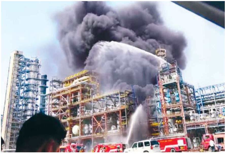
महानगर टाइम्स संवाददाता

मुख्यमंत्री और पेट्रोलियम मंत्रालय ने दिए घटना की उच्चस्तरीय जांच के आदेश