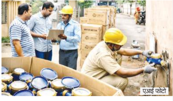
नए मीटर की डिमांड 40 प्रतिशत तक पहुंची

जयपुर। जैसे-जैसे गर्मी तेज हो रही है, वैसे-वैसे पानी की मांग के साथ जल मीटर से जुड़ी समस्याएं भी बढ़ती जा रही हैं। पिछले दो सप्ताह में शहर के अलग-अलग जोन क्षेत्रों से खराब जल मीटर बदलने और नए मीटर लगाने की शिकायतों में उल्लेखनीय बढ़ोतरी दर्ज की गई है। हालांकि, जलदाय विभाग फिलहाल अपनी प्राथमिकता पेयजल आपूर्ति को बनाए रखने पर रखे हुए है। विभाग का कहना है कि मई के अंत तक बड़े स्तर पर नए मीटर लगाने की प्रक्रिया शुरू की जाएगी। जलदाय विभाग से आंकड़ों के अनुसार पिछले 14 दिनों में जयपुर शहर के विभिन्न जोन क्षेत्रों से करीब 11 सौ से अधिक खराब जल मीटर की शिकायतें दर्ज हुई हैं। इनमें से सबसे ज्यादा शिकायतें परकोटा, आदर्श नगर, मानसरोवर और झोटवाड़ा क्षेत्रों से आई हैं। अधिकारियों के अनुसार पुराने इलाकों में लगे