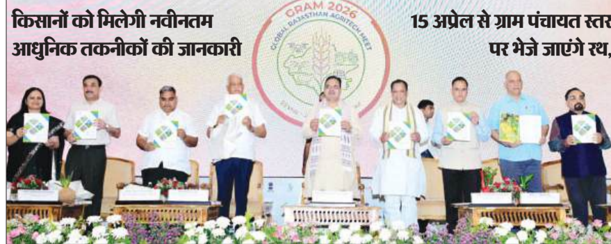
महानगर टाइम्स संवाददाता