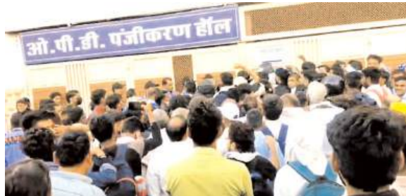
अपनी-अपनी लाइन बनाने में जुट गए।