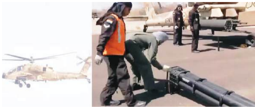
हेलिकॉप्टर के नीचे लगी चैन गन से 1200 राउंड प्रति मिनट की

इसके बाद हेलिकॉप्टर ने नीचे आकर 70 एएमएम हाइड्रॉ रॉकेटों से हमला किया, जिससे दुश्मन के कैम नष्ट हुए। अंत में