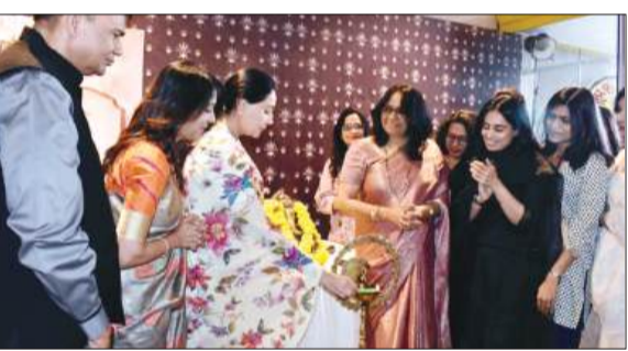
उप मुख्यमंत्री दिया कुमारी ने किया उद्घाटन