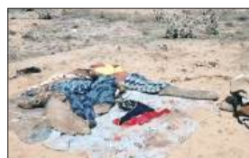
महानगर टाइम्स संवाददाता

झुंझुनू में एक बेकाबू ट्रेलर ने तंबू में सो रहे दो परिवार के 7 लोगों को कुचल दिया। हादसे में मां-बेटी समेत तीन लोगों की मौत हो गई। तीन लोगों की हालत गंभीर है। पुलिस ने ट्रेलर को ज्वल कर लिया है। हादसा नंगली दीप सिंह गांव में शुक्रवार सुबह 4 बजे हुआ। घटना से गुस्साए स्थानीय लोगों ने गुडगोइजी थाने के बाहर प्रदर्शन किया। उनकी मांग थी कि पीड़ित परिवारों को उचित मुआवजा दिया जाए।