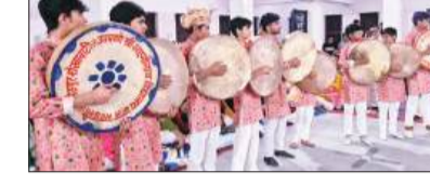
की सुरली आवाज ने लोगों को मंत्रमुग्ध किया। कार्यक्रम में राजस्थान की प्रसिद्ध दप और चंग की प्रस्तुति देने

फतेहपुर (महानगर टाइम्स संवाददाता)। फाल्गुन का महीना नजदीक आते ही शेखावाटी में जगह-जगह फागोत्सव की धूम मच जाती है। चंग और दप की थाप पर और बांसुरी की धूम में क्या बच्चे-क्या बुजुर्ग और क्या युवा, हर कोई इसे सुनने के लिए पहुंचता है। ऐसा ही जगह फतेहपुर के अमृत कृपा भवन में देखा गया। जहां फागोत्सव का आयोजन किया गया। छोटे-छोटे बच्चे जहां एक साथ चंग पर थाप देते नजर आए, वहीं बांसुरी