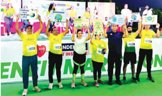
स्वच्छता के लिए किया जागरूक

महानगर संवाददाता जयपुर। जयपुर के विद्याधर नगर में रविवार सुबह फिटनेस और पर्यावरण संरक्षण का अद्भुत संगम देखा। रोटी क्लब ऑफ जयपुर रॉयल की ओर से आयोजित ग्रीन फिट मैराथन-द्वितीय संस्करण में बड़ी संख्या में जयपुराइट्स ने भागीदारी कर पर्यावरण संरक्षण का संदेश दिया। इस मैराथन का आयोजन मोशन ब्रेन्स प्रा. लि. द्वारा किया गया था, जिसमें खंडलवाल हार्ट इंस्टीट्यूट, केयर हेल्थ इंश्योरेंस तथा रोटी क्लब जयपुर रॉयल सहयोगी संस्थाएं रहीं। मैराथन में 3,000 से अधिक धावकों ने हिस्सा लिया जो जयपुर शहर के साथ-साथ आसपास के गांवों और प्रदेश के विभिन्न कोनों से आए थे और सभी ने मिलकर 'रन फॉर ग्रीन अर्थ' का संदेश जन-जन तक पहुंचाया। कार्यक्रम का शुभारंभ उपमुख्यमंत्री दीया कुमारी, रोटी