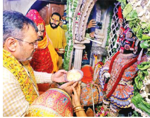
सेवा का आयोजन किया गया है।