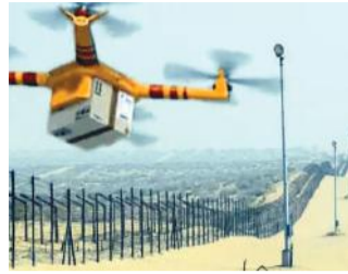
एटी ड्रोन टेक्नोलॉजी पर काम कर रही राजस्थान एटीएस

जानकारी में आया है कि राजस्थान में जो हेरोइन ड्रोन से गिर रही है। उसे तस्कर अलग-अलग माध्यम से पंजाब और अन्य राज्यों में भेज रहे हैं।