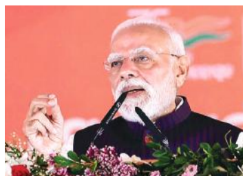
छठ पूजा का भी किया जिक्र

दुर्भाग्य से आजादी के बाद खादी की रौनक कुछ फीकी पड़ती जा रही थी, लेकिन बीते 11 साल में खादी के प्रति देश के लोगों का आकर्षण बहुत बढ़ा है। मैं आप सभी से