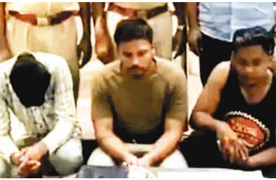
लोगों का माइंड वॉश कर खरीद लेतो थे बैंक खाता