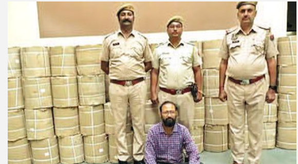
पहले 25 फिर 31 लाख का मंगवाया माल