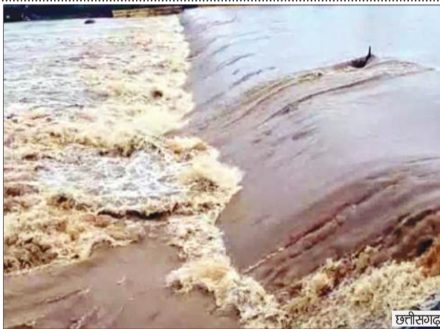
उग्र के बलिया में 6 मकान और 5 दुकानें गंगा में समाईं

इधर हिमाचल के मंडी जिले के धर्मपुर में सपड़ी रोह गांव में लैंडस्लाइड हुई। कई घरों तक मलबा पहुंच गया। 8 घर खाली भी करार गए। राज्य में बारिश-बाढ़ से मरने वालों का आंकड़ा 386 पहुंच गया है। राज्य में 12 सितंबर तक 133 फीसदी ज्यादा बारिश रिकॉर्ड हुई है। इस पीरियड में 64.6 एमएम बारिश की तुलना में 150.4 एमएम बारिश हो चुकी है।