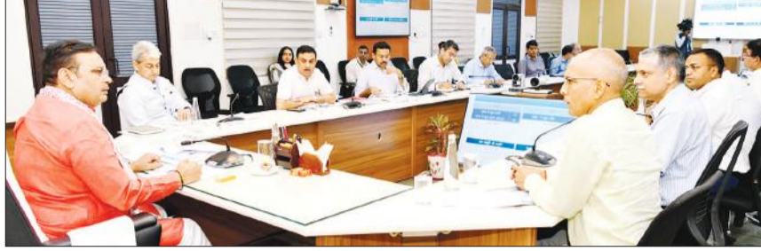
साथ कार्य कर रही है। इनसे प्रदेशभर में आमजन को पर्याप्त जलापूर्ति मिलेगी। उन्होंने लंबित परियोजनाओं को निविदाओं में गति लाते हुए कार्यादेश शीघ्र जारी करने के लिए निर्देश दिए।

जयपुर। मुख्यमंत्री भजनलाल शर्मा ने आमजन के लिए पेयजल आपूर्ति परियोजनाओं को सरकार की प्राथमिकता बताया है। उन्होंने कहा कि ये परियोजनाएं समय पर ही पूरी होनी चाहिए। इसमें कोताही बर्दाश्त नहीं होगी। सीएम भजनलाल शर्मा मंगलवार को मुख्यमंत्री निवास पर जन स्वास्थ्य अभियांत्रिकी विभाग की वर्ष 2025-26 की बजट घोषणाओं की समीक्षा कर रहे थे। उन्होंने कहा कि राज्य सरकार वृहद् जल परियोजनाओं के क्रियान्वयन पर प्रतिबद्धता के साथ कार्य कर रही है। इनसे प्रदेशभर में आमजन को पर्याप्त जलापूर्ति मिलेगी। उन्होंने लंबित परियोजनाओं को निविदाओं में गति लाते हुए कार्यादेश शीघ्र जारी करने के लिए निर्देश दिए।