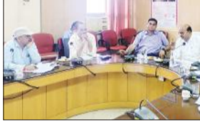
ओरल रीडिंग फ्लूएन्सी कार्यक्रम पर हुई परिचर्चा

जयपुर। मुख्यमंत्री शिक्षित राजस्थान अभियान के तहत कक्षा 3 से 8 तक के विद्यार्थियों के लिए चल रहे ओरल रीडिंग फ्लूएन्सी कार्यक्रम की रीडिंग