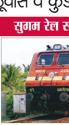
एक्सप्रेस 20 से 29 अगस्त तक (दोनों 10 ट्रिप), 19620 रेवाड़ी-फुलेरा एक्सप्रेस और 19621 फुलेरा-रेवाड़ी एक्सप्रेस 20 से 29 अगस्त तक (दोनों

जयपुर। उत्तर पश्चिम रेलवे द्वारा जयपुर मंडल के फुलेरा-रींगस-रेवाड़ी रेलखंड के मध्य अटेली-काठवास-कुंड स्टेशनों पर दोहरीकरण कार्य के कारण नॉन-इंटरलॉकिंग कार्य किया जा रहा है। इस कारण कई ट्रेनें प्रभावित रहेंगी। इनमें 19619 फुलेरा-रेवाड़ी एक्सप्रेस और 19622 रेवाड़ी-फुलेरा एक्सप्रेस 1 से 29 अगस्त तक (दोनों 29 ट्रिप), 14705 भिवानी-देहरा का बालाजी एक्सप्रेस और 14706, देहरा का बालाजी-भिवानी