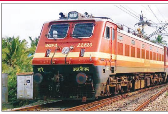
एक्सप्रेस 20 से 29 अगस्त तक (दोनों 10 ट्रिप), 19620 रेवाड़ी-फुलेरा एक्सप्रेस और 19621 फुलेरा-रेवाड़ी एक्सप्रेस 20 से 29 अगस्त तक (दोनों

जयपुर। उत्तर पश्चिम रेलवे द्वारा जयपुर मंडल के फुलेरा-रींगस-रेवाड़ी रेलखंड के मध्य अटेली-काठवास-कुंड स्टेशनों पर दोहरीकरण कार्य के कारण नॉन-इंटरलॉकिंग कार्य किया जा रहा है। इस कारण कई ट्रेनें प्रभावित रहेंगी। इनमें 19619 फुलेरा-रेवाड़ी एक्सप्रेस और 19622 रेवाड़ी-फुलेरा एक्सप्रेस 1 से 29 अगस्त तक (दोनों 29 ट्रिप), 14705 भिवानी-देहरा का बालाजी एक्सप्रेस और 14706, देहरा का बालाजी-भिवानी