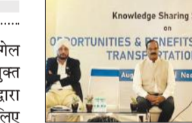
Knowledge Sharing Session on Opportunities & Benefits in Using Transportation Fuels