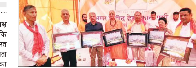
वाली पीढ़ियों को भी राष्ट्रभक्ति का संदेश देगा। शाहपुरा के लिए यह एक ऐतिहासिक और सांस्कृतिक धरोहर साबित होगी।