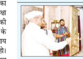
राज्यपाल हरिभाऊ बागडे मंगलवार को बांसवाड़ा के मां त्रिपुरा सुंदरी में पूजा-अर्चना की। उन्होंने मां त्रिपुरा सुंदरी से प्रदेश की सुख-समृद्धि और सुखहाली की कामना भी की।