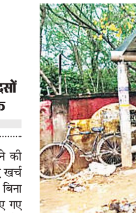
वेशाली नगर के व्हीस रोड पर लगा बस शेल्टर हुआ कबाड़।

जयपुर। शहर को स्मार्ट सिटी बनाने की कवायद में जेसीटीएल ने करोड़ों रुपए खर्च कर स्मार्ट क्यू शेल्टर तैयार किए थे। बिना किसी योजना के जल्दबाजी में बनाए गए इन शेल्टर्स पर बसें रुक ही नहीं रही हैं। इस कारण यात्रियों को शेल्टर से दूर या बीच सड़क पर बस से उतरना पड़ रहा है। एक आंकलन के मुताबिक शहर में 180 लोक फ्लोर और 1200 मिनी बसें के माध्यम से रोजाना करीब 5 लाख से ज्यादा यात्री बसें से सफर करते हैं। सरकार की मंशा के अनुरूप जेसीटीएल ने शहर के