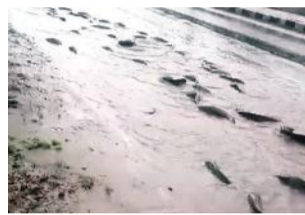
नागौर जिले के रियांबड़ी स्थित लामपोला तालाब से मछलियां बहकर सड़क पर आ गईं।

न्यूनतम 27.1 डिग्री दर्ज किया गया। जयपुर के दूध में नरेना डैम की पाल टूटने से कई ढांगियों से संपर्क टूट गया है। कानोता डैम ओवरफ्लो हो गया है। नागौर के रियांबड़ी में तालाब भरने से सैकड़ों मछलियां सड़कर पर तैरने लगीं। बूंदी में जगह-जगह जलजमाव होने के कारण गर्भवती महिला को जेसीबी से रास्ता पार कराया गया। केरल से अपने गांव आए बाड़मेर के कपड़ा व्यापारी की रविवार को कुंड में डूबने से मौत हो