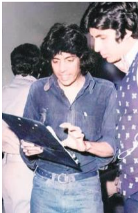
जुड़ा रहे थे।

अ मिताभ बच्चन की सुपरहिट फिल्म 'डॉन' के निर्देशक चंद्र बरोट का रविवार को मुंबई में 86 वर्ष की आयु में निधन हो गया। उनकी पत्नी दीपा बरोट ने इस खबर की पुष्टि की। बरोट पिछले कई वर्षों से अपने फेफड़ों का इलाज करा रहे थे। निधन से पहले, शहर के गुरु नानक अस्पताल में डॉ. मनीष शेड्डी उनका इलाज कर रहे थे। इससे पहले, उन्हें जसलोक अस्पताल में भर्ती कराया गया था। उनकी पत्नी दीपा बरोट ने को बताया कि वह पिछले सात सालों से पल्मोनरी फाइब्रोसिस से