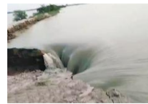
टोंक के बरवास स्थित इस्लामपुर बांध की पाल टूट गई।

गई। टोंक के बरवास स्थित इस्लामपुर बांध की पाल टूट गई। वहीं सबसे