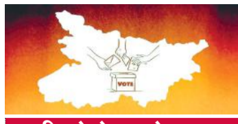
कितने वोटर टारगेट पर?

खंगाल रही है, उनका डाटा जुटा रही है और संगठन से जोड़ने में जुटी है। इस अभियान के जरिए भाजपा उन प्रवासी बिहारी मतदाताओं तक पहुंच रही है, जो राजस्थान में रहते हैं, लेकिन वोटर आज भी बिहार के हैं। उनका पूरा डेटा फॉर्म भरवाकर पार्टी के आंतरिक सरल एप पर अपलोड किया जा रहा है।