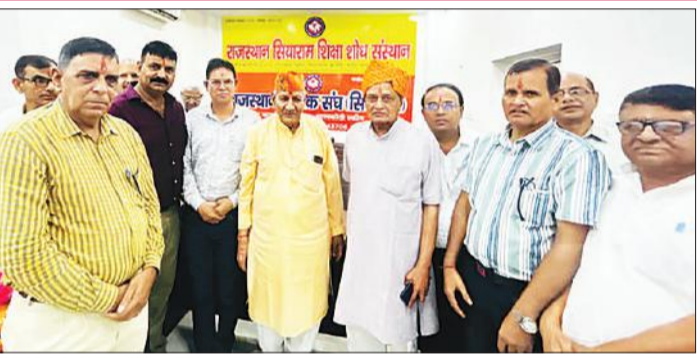
कि राजस्थान शिक्षक संघ (सियाराम) वाला प्रमुख संघर्षशील संगठन है। शिक्षा व शिक्षार्थियों के हित में कार्य करने संगठन के पदाधिकारी व शिक्षक