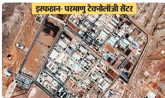
इस्फहान-परमाणु टेक्नोलॉजी सेंटर

अब शांति बनानी चाहिए। अमेरिकी राष्ट्रपति ने कहा है कि हमलों का मकसद 'ईरान को परमाणु बम बनाने से रोकना और दुनिया को परमाणु खतरे से बचाना' था। मैं दुनिया को बता सकता हूँ कि यह हमला एक शानदार सैन्य सफलता थी।