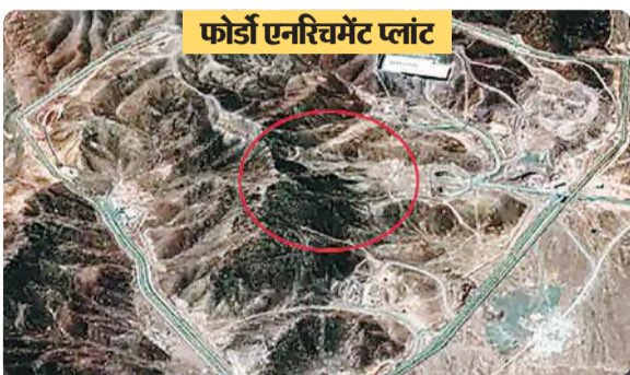
फोर्डो एनरिचमेंट प्लांट

अमेरिकी राष्ट्रपति डोनाल्ड ट्रंप ने कहा कि उनकी वायु सेना ने ईरान के तीन परमाणु ठिकानों फोर्डो, नतांज और इस्फहान न्यूक्लियर साइट्स पर बड़ा हमला किया है। अमेरिकी सेना ने इन ठिकानों पर पूरी तैयारी के साथ बम गिराए, जिसमें मुख्य निशाना फोर्डो था। डोनाल्ड ट्रंप ने बताया कि सभी लड़ाकू विमान सुरक्षित रूप से