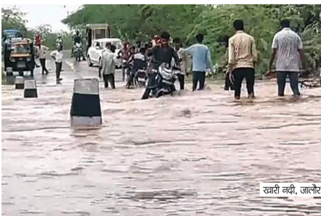
खारी नदी, जालौर

भीलवाड़ा में कोठारी नदी का पानी पुल के ऊपर से बह रहा है। सिरोही में नेशनल हाइवे (दिल्ली-गुजरात) पर पानी भर गया है। इससे दिल्ली से कांडला