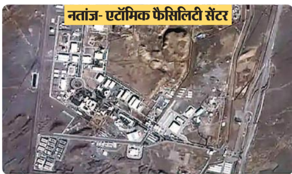
नतांज एनरिचमेंट प्लांट

बड़ी उपलब्धि बताया और अब शांति की अपील की है। यह हमला शांति समय हुआ जब ईरान के परमाणु कार्यक्रम को लेकर इजराइल के सामने चिंता बनी हुई है।