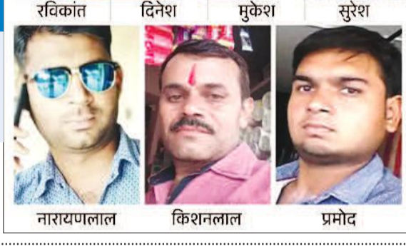
रविकांत दिनेश मुकेश सुरेश नारायणलाल किशनलाल प्रमोद