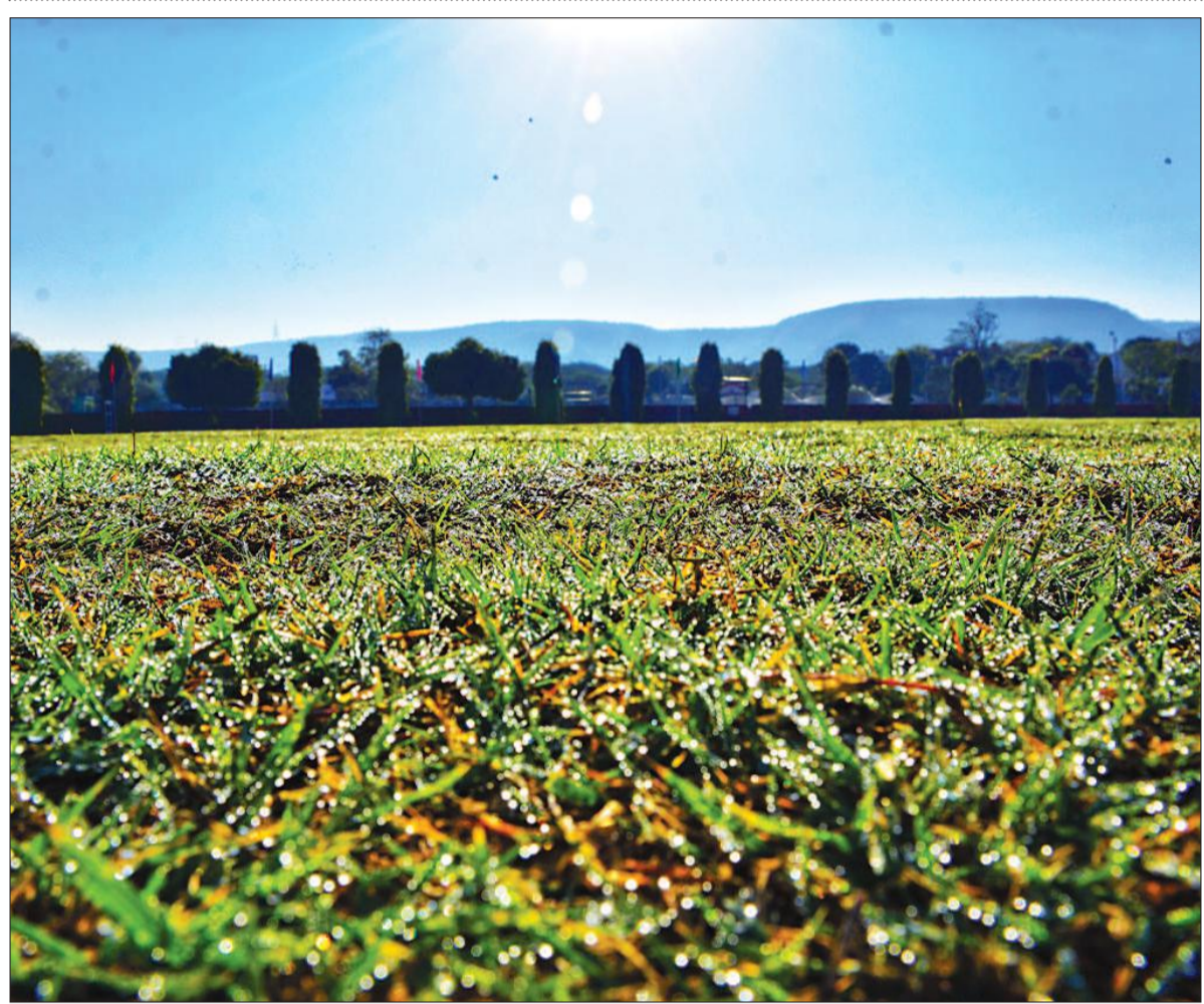
जयपुर। बदलते मौसम के साथ प्रकृति की तस्वीर बदलने लगी है। सुबह-शाम सर्दी और दिन में ठेप धूप दिखने लगी है। वहीं राजस्थान यूनिवर्सिटी के स्पোর্ट्स ग्राउंड में सुबह के समय घास पर जम रही ओस की बूंदें मोती की तरह अपनी आभा बिखेर रही हैं।