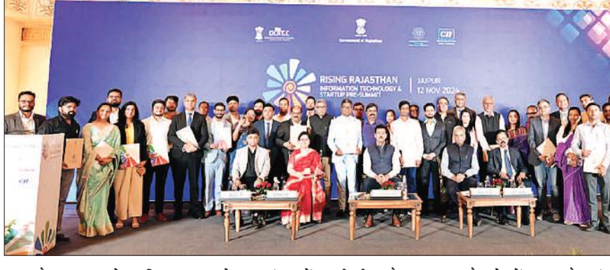
कदम है। हमारा उद्देश्य टियर 2 और टियर 3 शहरों के स्टार्टअप को उन संसाधनों, मार्गदर्शन और रणनीतिक सहयोग तक पहुंच प्रदान करना है जो बंगलुरु और मुंबई जैसे बड़े हब में उपलब्ध हैं।

डॉ. चौधरी ने कहा कि राइजिंग राजस्थान के साथ यह एमओयू इनोवहर के लिए एक महत्वपूर्ण