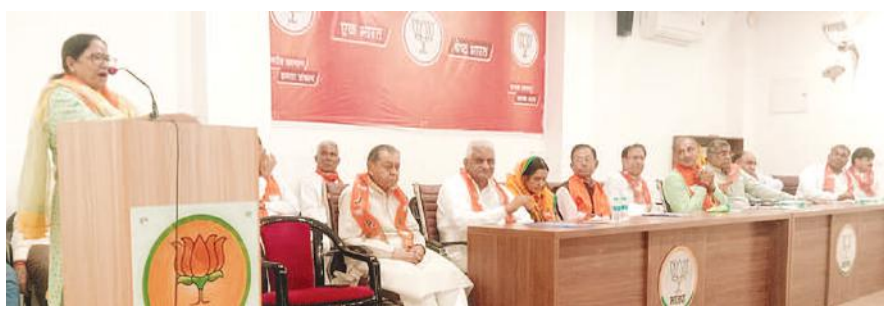
राजनीतिक पार्टियों से अलग है। अलग पार्टी ऐसे है कि भाजपा में कार्यकर्ता को कब और क्या जिम्मेदारी मिल जाए, यह किसी को पहले पता नहीं होता। यह पार्टी कार्यकर्ता की मेहनत, लगन व

महानगर संवाददाता संतोष अहलावत की कार्यशाला में भाजपा के कार्यकर्ताओं को संबोधित करते हुए संतोष अहलावत ने कहा कि भाजपा देश की अन्य