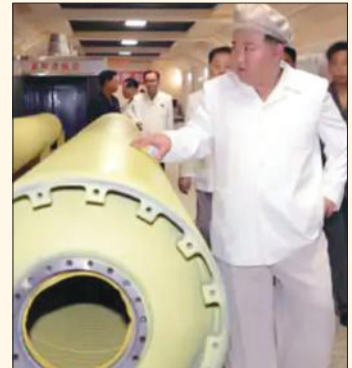
पर चर्चा हुई। हालांकि, बैठक में किसी भी दुरमन देश का नाम नहीं लिया गया।

सोल उत्तर कोरियाई नेता किम जोंग एक बार फिर अपने दुरमनों से निपटने के लिए तैयारी में जुट गए हैं। उन्होंने अपनी सेना के शीर्ष जनरल को बदल दिया है। साथ ही सेना को युद्ध की हर संभव स्थिति में तैयार रहने के लिए कहा है। इतना ही नहीं, उन्होंने हथियारों के उत्पादन में वृद्धि और सैन्य अभ्यास बढ़ाने का भी आदेश दिया है।